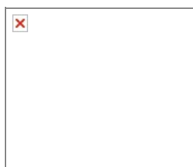
Рис. П5.8 - Плоскоцилиндрическое взрывонепроницаемое соединение