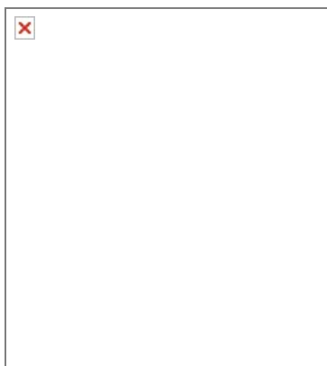
Рис. Пб.1. Кольцо для уплотнения проводов